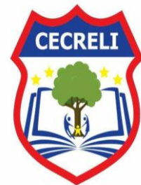
CENTRO EDUCATIVO CRECIENDO & LIDERANDO Comprometidos con el proceso de calidad y transformación social