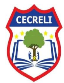
CENTRO EDUCATIVO CRECIENDO & LIDERANDO Comprometidos con el proceso de calidad y transformación social